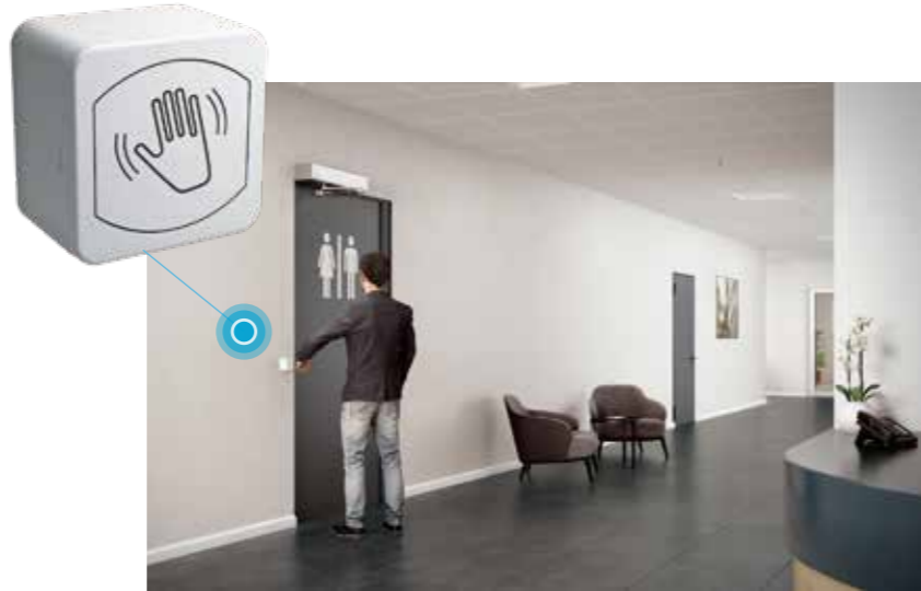
ASSA ABLOY SA13 无接触式感应开关

感应开关是无障碍自动门的理想之选。当行人向门走近时，门会自动打开，无需用手或肘部按压开关。